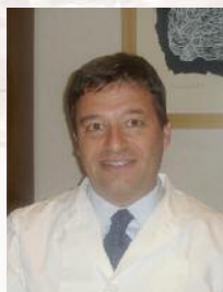
Direttore del Corso